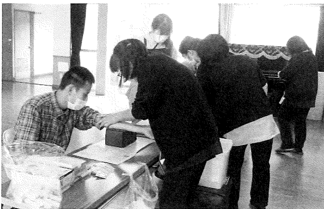
痛いけど……がまん!! (健康診断)

そんなある日のこと、ある利用者さんから「毎日毎日嫌になるよ。何か楽しいことはないのかな？」と声をかけられました。楽しい事なんて・・・と卑屈になっていた気持ちで見ていたテレビには新型コロナウイルス追悼番組が流れていました。古い映