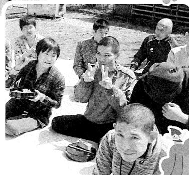
中台特製お花見弁当は園庭でいただきました