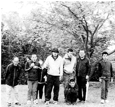
はまなす公園に行ってきた (ピクニック)

成長と言えども一つ。昨年4月、私は初めて受け持つグループの担当となり、掃除や洗濯干しのやり方をそれまでと「少し」変え、その経過を見てきました。一年経つてみると、窓拭き係は新たに1名が加わ