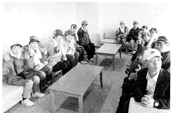
VIP ルームへのご招待ありがとうございました。(サッカー観戦招待:新日鐵住金様)