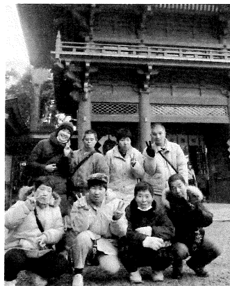
鹿島神宮に初詣に行きました

みややる気が現れるようになりました。今、私は中台育心園に従事し、対象の方は老人から障害者に変わりました。しかし、変わらない事があります。職員の気持ちや心にゆとりがなければ、利用者さんの笑顔は引き出せない、という事です。この信念を持って、これからも利用者の皆さんが笑顔で過ごせるように励んでいきたいと思っています。