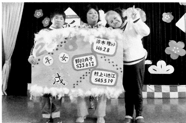
今年の年々です(新年会)

中台育心園のスプリングクラー設置工事が3月上旬には完了しました。二箇月半以上、利用者の皆様、ご家族の皆様には何かとご迷惑をおかけいたしましたこと、紙面をお借りしましてお詫び申し上げます。 今年度を振り返りますと、支援現場は高齢の利用者さんを中心に入院退院と通院に追われました。誤嚥性の慢性肺炎、腸閉塞、精神疾患や急激な身体機能の低下など、ご家族ご親族の方の協力なくしては入院治療が進まないことに再三思い知らされた一年でした。また一方で、社会福祉法の一部改正による新たなルールでの法人経営がスタートしました。ドタバタしながらも軌道に乗ったかなという感じです。政府が掲げる「働き方改革」とは一体何なのか、平成15年度から続く福祉制度の改正・改革がなされる度に疑問に思わざるを得ないのは私だけでしょうか。 さて、平成30年度の障害福祉サービス等報酬改定が、今年の2月5日に国より示されました。障害者の重度化・高齢化を踏まえた地域移行と地域生活支援の充実、障害者の就労支援等の推進を図る上での新たなサービスである自立生活援助と就労定着支援等の新設、また、共生型サービス(※1)の特例の設置、地域生活支援拠点等の機能を担う事業所(※2)の見直し等が資料に記され