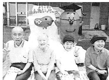
おいしいお寿司食べました (大洗・那珂美遠征)