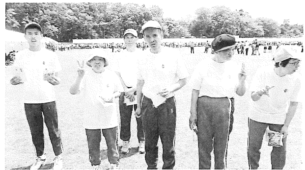
景品もバッジもゲットひきました! (ゆうあいスポーツ)

長い地球の歴史の中で、これまで複数の人類が生まれ、絶滅してきました。その中、唯一生き残った現存人類、ホモサピエンス。それが私たちです。私たちが過酷な生存競争に勝った理由の一つが、言語を使う事ができた、という説があります。進化の中で複雑な発声器官を獲得し、それを『言語』という精密な情報交換手段に活かす事ができた。正確な情報は、より多くの仲間に安全な行動を知らせる事ができ、結果、固い牙も強い筋肉も持たない、かよい生き物にも関わらず、私たちが今の