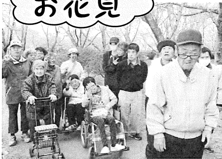
全員で城山公園へ！春を満喫しました