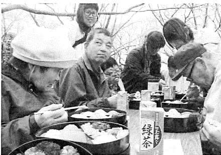
中台特製 お花見弁当☆