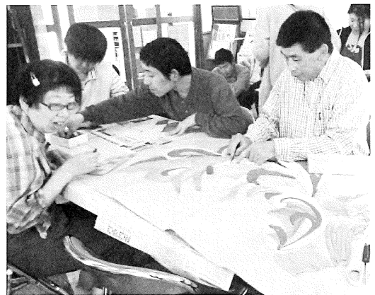
こより絵作成中 (創作的活動)

振り手振りを加えて同じ問題をだしてみてください。今回の回答は、前回ほどバラバラではないと思います。全く同じでないにしろ、どこか共通点が出てきているのではないのでしょうか。