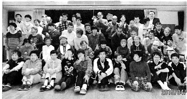
全員集合で新年度スタート!!

ある休日。珍しく早い時間に目が覚めました。でも、予定なし。ぼーっと空を眺めていたら、突然、年に数回だけオンになる『大掃除スイッチ』が入りました。今回の大掃除ターゲットは、窓。一枚一枚窓枠から外して風呂場に運んで丸洗いです！ついでに棧も、ブラシでゴシゴシ洗いです！ 家を小さく建ててくれた両親に心の底から感謝しながら5、6時間。ピカピカになった窓を眺めて、大満足♪充実した一日でした。 そして翌日、今年初の台風接近情報。車を洗うと雨が降り、窓を洗うと台風が来るのですね。(泣) (チヨダ)