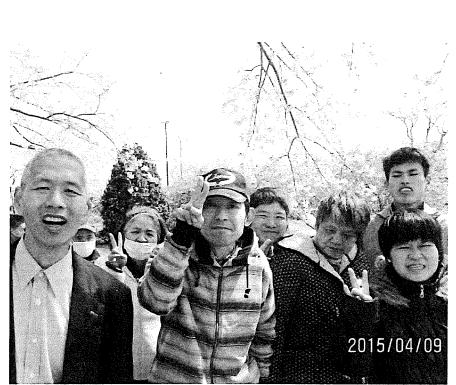
満開の桜の木の下で (お花見)

他に、私生活や職務を通して思う事があります。『体力』についてです。当施設では体力づくりの一環として