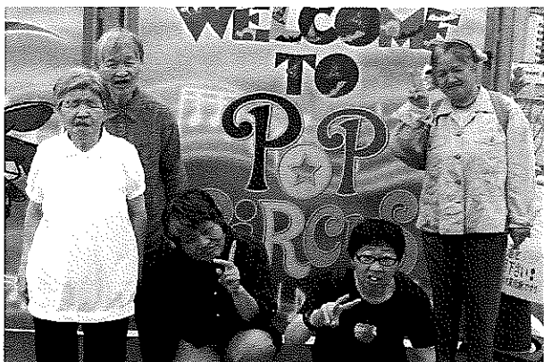
ポップサーカスに行ってきました！