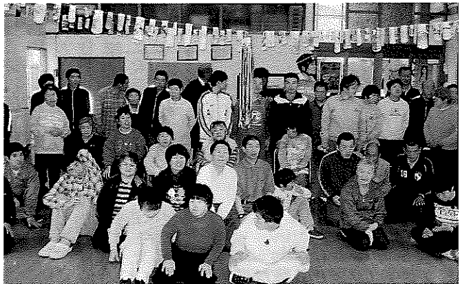
みんなで大ホールを飾りました♪

主な特色として、①障害者の範囲に130の難病等が加えられたこと、②個の心身の状態等から判定された障害程度区分が、必要とされる支援の度合で示す「障害支援区分」に改められること、③重度の知的障害者、精神障害者も重度訪問介護の対象となること、④ケアホームがグループホームへ一元化されること、⑤地域移行支援の対象が入所施設や精神病院の障害者だけでなく矯正施設等を退所する障害者にも拡大されたこと、⑥市町村に対し、障害者に対する理解を深めるための研修・啓発を行う事業等を必須としたり、基本指針や障害福祉計画の見直しを法定化するなど、サービス基盤の計画的整備が進められたことがあげられます。②③⑤については、平成26年4月施行です。 入所施設の変革は表面上ごさいません。共生社会の実現に向けて、グループホーム事業がその大きな中核