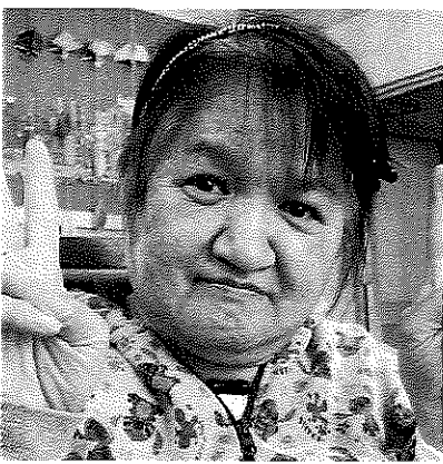
よろしくお願いします。

初めは少し緊張や不安もあったと思いますが、もうグループに溶け込んで仲間たちと仲良く生活しています。