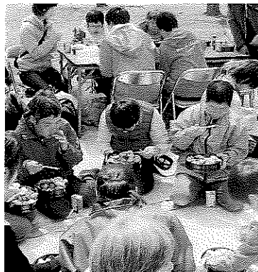
お弁当箱の中に豪華な花が咲いています。

当日は天候にも恵まれ、絶好のお花見日和でしたが、残念ながら連日の強風で桜はほとんど散ってしまっていました。しかし、豪華なお花見弁当(施設厨房の手作りです)で目もお腹も満たされみんな大満足。まさに花よりダンゴ(笑)。春の心地よい日差しと風に吹かれながらの園内散策では、「気持ちいいね」とお互いに笑顔を交わしていました。 来年のお花見は、満開の桜が見られますように。 (神崎)