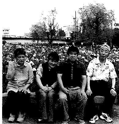
あやめまつりに行ってきました。

低めでした。規則正しい施設での生活がこのような良い結果をもたらしているように思います。いかに生活習慣が大切か実感しました。今後も、利用者の皆さんが健康と笑顔を絶やさず明るい気持ちで過ごせるように支援していきたいと思っています。