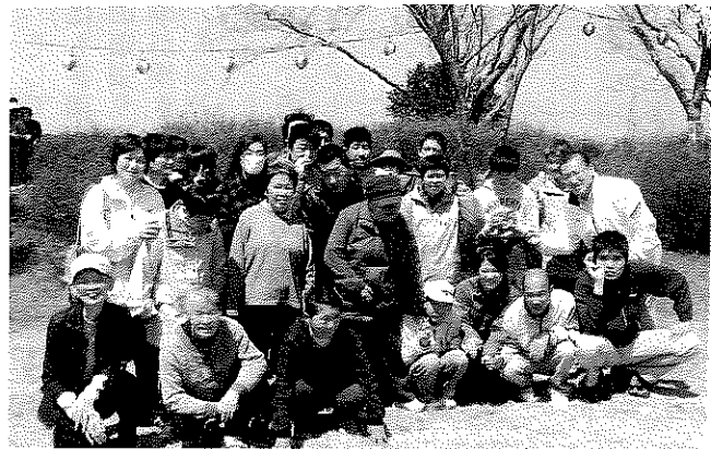
桜は八分咲きでも笑顔は満開です（お花見）

当園においても実際に送迎業務を行っておりますので人ごとではありませぬ。送迎前後の車両点検、送迎