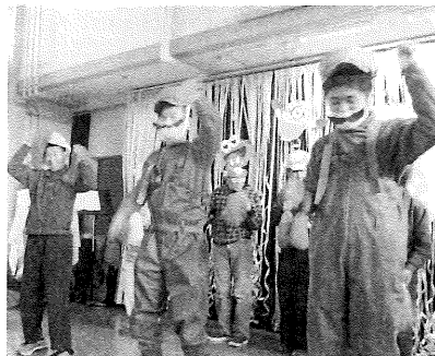
ふれあい会のひとこま (ふれあい会)