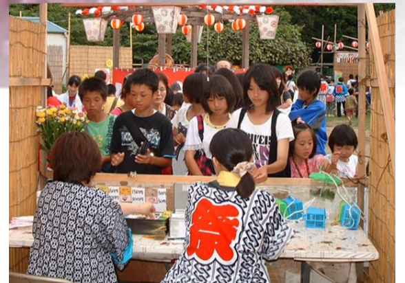
地域交流行事「夏祭り」には、大勢の子供たちが遊びに来ます。