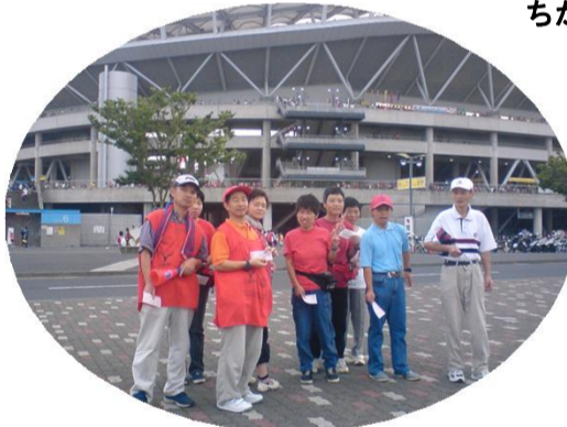
Jリーグサッカー観戦が大好き！

施設行事やクラブ活動の他、地域行事や施設間交流への参加、個別の買物・外食等の支援を行います。