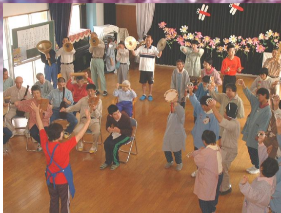
音楽を通して心のケアを行います。 (ミュージック・ケア)