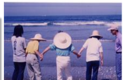
くつろぎのひと時(鹿島灘にて)