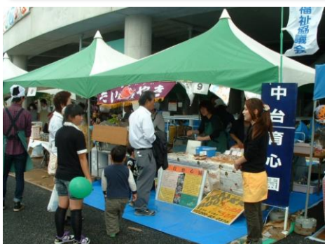
みんなの広場「たい焼き大好評！」