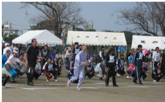
「悪戦苦闘？」大野地区市民体育祭にて