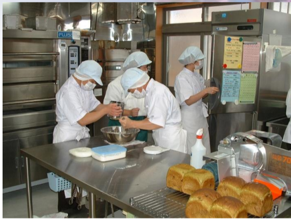
熱心にパンづくりに取り組む仲間たち

昭和54年10月24日 社会福祉法人みのり会認可 昭和55年 5月 1日 知的障害者更生施設 中台育心園開設(定員40人) 昭和56年 4月 1日 中台育心園定員50人 平成 元年10月 1日 グループホーム梵天開設(定員4人) 平成 4年 8月26日 短期入所事業開始(定員2人) 平成18年 1月 1日 グループホーム千葉開設(定員4人) 平成22年 4月 1日 障害者支援施設へ移行 定員3施設入所支援46人 生活介護60人 平成23年 4月 1日 グループホーム梵天新築(定員5人)